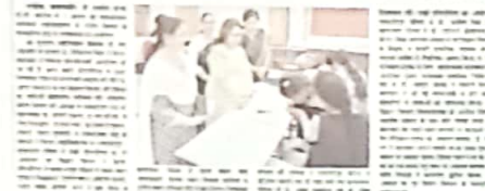
13 नवम्बर, 2024 को आयोजित मिश्रान शक्ति कार्यक्रम में सम्मिलित छात्राएँ एवं शिक्षकगण